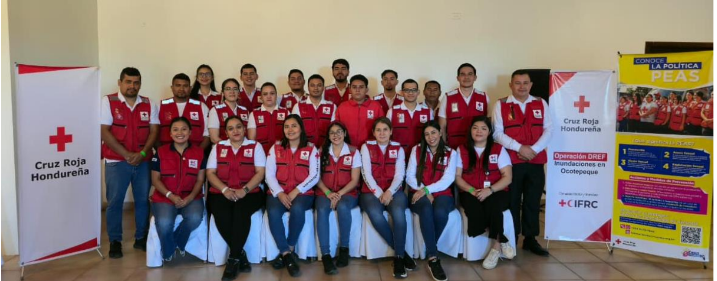
Foto grupal del taller de Lecciones Aprendidas del IFRC-DREF Inundaciones Ocotepeque de Cruz Roja Hondureña. Enero 2026

En el marco del compromiso con la mejora continua y la rendición de cuentas, Cruz Roja Hondureña desarrolló un taller de lecciones aprendidas a la emergencia MDRHN026: Inundaciones Ocotepeque, ejecutada en respuesta a través del Fondo de Emergencia para la Respuesta a Desastres (DREF) de la IFRC. Esta operación fue implementada durante un periodo de seis meses, del 07 de julio de 2025 al 31 de enero del 2026.